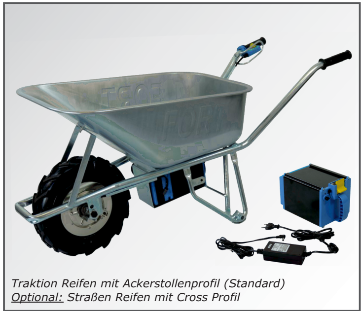
Traktion Reifen mit Ackerstollenprofil (Standard) Optional: Straßen Reifen mit Cross Profil