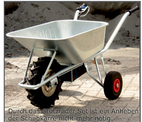
Durch das Stützräder Set ist ein Anheben der Schubkarre nicht mehr nötig.