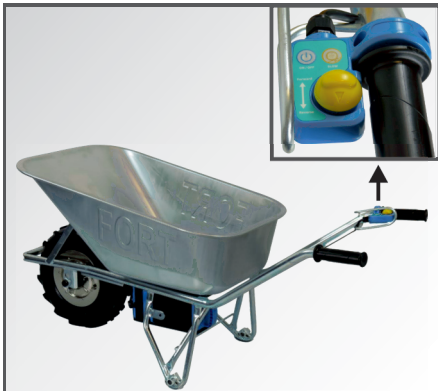
Joysticksteuerung mit Bergabfahrhilfe (HDC) und Handschutz direkt am Handgriff. Einfach mit dem Daumen zu bedienen.