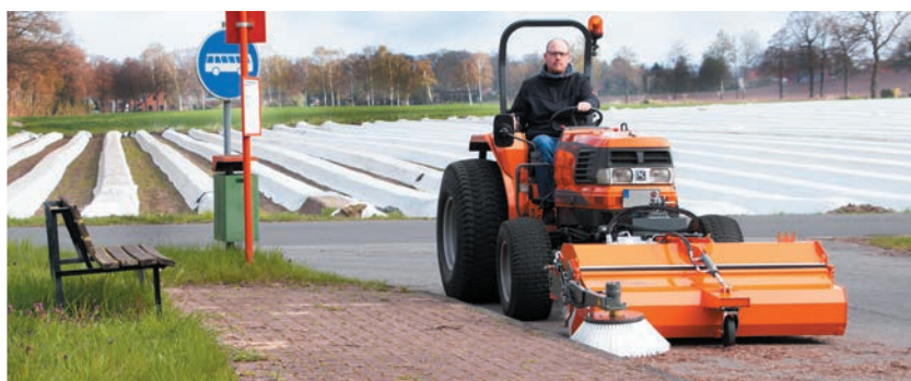
bema Kommunal 580 Dual mit Seitenkehrbesen - optimal für Bordsteine, Rinnsteine und an Gebäuden