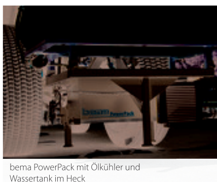
bema PowerPack mit Ölkühler und Wassertank im Heck