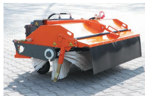
bema Kommunal 580 Dual mit Gummispritztuch (ohne Schmutzsammelwanne), Schneekehrwalze