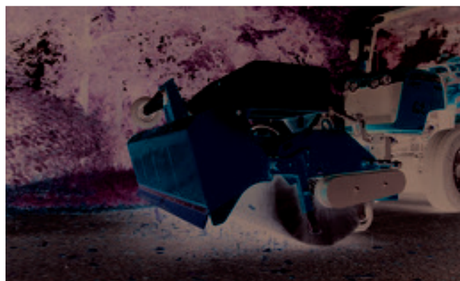
Schmutzsammelwanne im Dual-System - Plitzschnell zwischen Freikehre und Schmutz aufnehmen wechseln