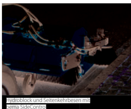
Hydroblock und Seitenkehrbesen mit bema SideControl